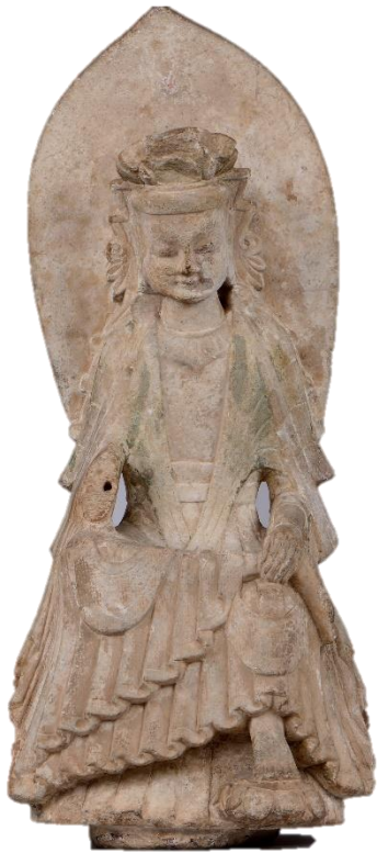
重要文化財「菩薩半跏思惟像」 中国 北魏時代(6世紀前半) 永青文庫蔵