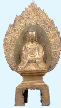
重要文化財「如来坐像」 中国 宋時代 元嘉14年(437年) 永青文庫蔵