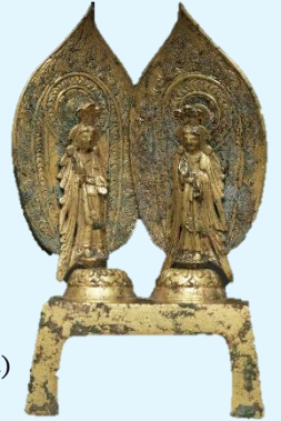
「双観音立像」 中国 北齊時代 天保8年(557年) 個人蔵