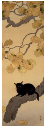
1. 重要文化財 菱田春草「黒き猫」明治43年(1910) 永青文庫蔵(熊本県立美術館寄託)