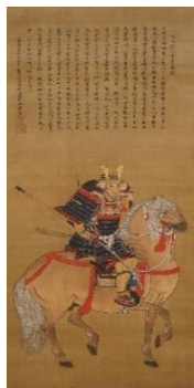
4. 重要文化財 狩野元信「細川澄元像」 室町時代 永正4年(1507) 【前期展示】