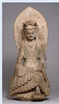
重要文化財 「菩薩半獅思惟像」 中国 北魏時代(6世紀前半)