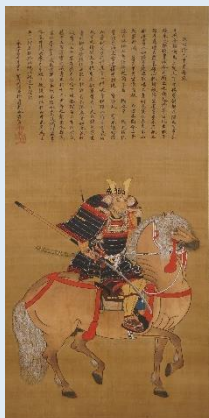
重要文化財 狩野元信「細川澄元像」 室町時代 永正4年(1507) 【前期展示】

刀剣、禅画、近代絵画、東洋美術など、実に多彩な護立のコレクション。国宝・重要文化財を含む様々な分野の作品を展示し、蒐集の軌跡をたどります。