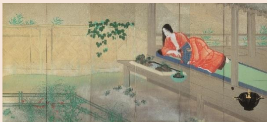
重要文化財(新指定) 松岡映丘「室君」大正5年(1916) 熊本県立美術館寄託【前期展示】

永青文庫の所蔵品のなかで高い人気を集める菱田春草「黒き猫」や「落葉」をはじめ、新たに重要文化財に指定された松岡映丘「室君」と平福百穂「豫譲」など、近代日本画コレクションを代表する作品を紹介します。