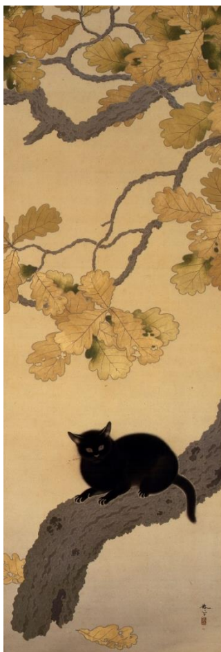
重要文化財 菱田春草「黒き猫」明治43年(1910) 熊本県立美術館寄託