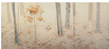
2. 重要文化財 菱田春草「落葉」明治42年(1909) 永青文庫蔵(熊本県立美術館寄託)【後期展示】