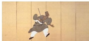
3. 重要文化財 平福百穂「豫譲」大正5年(1917) 永青文庫蔵(熊本県立美術館寄託)【前期展示】