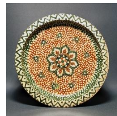
8. 重要文化財 「三彩宝相華文三足盤」 中国 唐時代(7~8世紀)