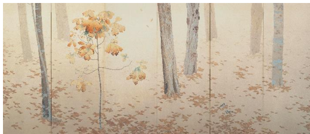
重要文化財 菱田春草「落葉」明治42年(1909) 熊本県立美術館寄託【後期展示】

“美術の殿様”とも呼ばれた細川護立。その珠玉のコレクションを存分にお楽しみください。