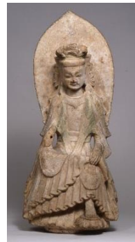
7. 重要文化財 「菩薩半跏思惟像」 中国 北魏時代(6世紀前半)