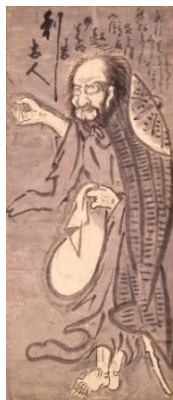
5. 白隠慧鶴「大燈国師像」 江戸時代中期(18世紀) 【後期展示】