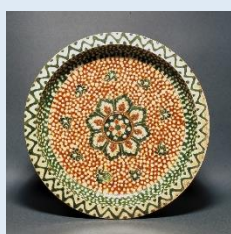
重要文化財 「三彩宝相華文三足盤」 中国 唐時代(7~8世紀)