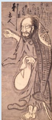
白隠慧鶴「大燈国師像」 江戸時代中期(18世紀) 【後期展示】