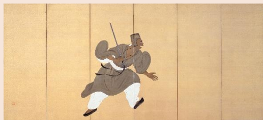
重要文化財(新指定) 平福百穂「豫譲」大正5年(1917) 熊本県立美術館寄託【前期展示】