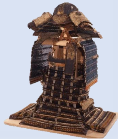
しろいとおどりおどしよろい 重要文化財「白糸褰取威鎧」 細川頼有所用 南北朝時代(14世紀) 永青文庫蔵

第1章では、「三斎流」の甲冑のほか、始祖・頼有(1332~91)が建仁寺塔頭永源庵に納めた「白糸褰取威鎧」(重要文化財)など、細川家が代々お家の宝としてきた甲冑や鞍などを紹介します。