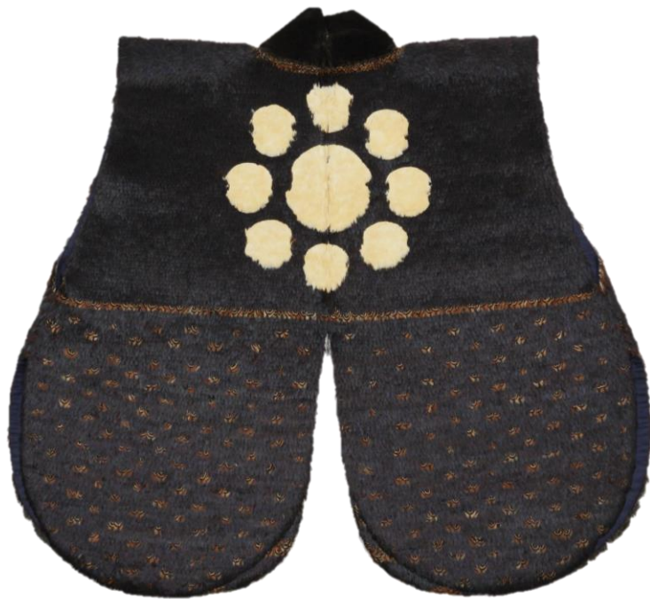
とりげくようもんつきじんばおり 「鳥毛九曜紋付陣羽織」 細川斉樹所用 桃山～江戸時代 (16世紀末～17世紀前半) 永青文庫蔵