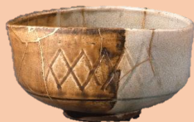
かけわけちやわん めい ねんぼち 「掛分茶碗 銘 念八」 江戸時代(17世紀) 永青文庫蔵

武家社会で重んじられてきた茶の湯や能は、武将たちにとって必須科目。そのため、それらにまつわる品々は大家家にとって欠かせないものでした。細川家には茶道具や能道具が多数伝来していることから、細川家の人々が武芸だけでなく、文化・芸能においても、高い見識と技能を身につけていたことがわかります。