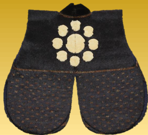
「鳥毛九曜紋付陣羽織」 細川齊樹所用 桃山～江戸時代(16世紀末～17世紀前半) 永青文庫蔵

17世紀中期以降の陣羽織は、実用性よりも見た目を重視した形式的なものがつくられていましたが、本作は使用されている素材や装飾、仕立ての手間のかけ方などから、実戦を想定したつくりになっていることが判明しました。素材は羽根のほか、木綿、和紙、薄綿、 びろーど 天鷲絨を使用し、雨天や冬場の戦に適したものを着用しています。本作のように鳥の羽根を用いた陣羽織は類例が少なく、貴重な作品です。