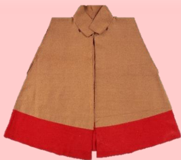
うすちやひらしやじんぼり 「薄茶緋羅紗地陣羽織」 細川忠利所用 江戸時代(17世紀) 永青文庫蔵

武将にとって陣羽織や鎧下着といった戦着はおしゃれアイテムのひとつ。鎧の上に着用する陣羽織には、高い実用性と視認性が重視され、外国産の裂が用いられたり、奇抜な意匠が取り入れられるなど、武将の個性が反映されています。また、鎧の下に着用する鎧下着は、表からはあまり見えないにも関わらず、細かな模様を華やかに表すなど、凝った意匠のものがつくられました。これらの戦着は、戦がなくなった時代にも、甲冑と同じように代々が備えました。