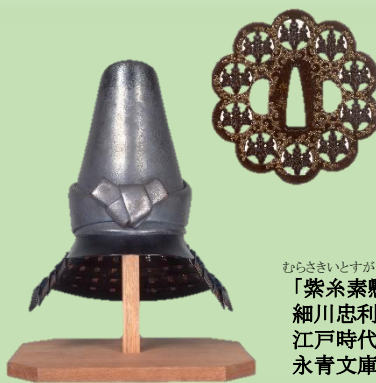
きりもんすかしからくさもんつば 「桐紋透唐草文鐔」 銘 楽寿 神吉楽寿作 江戸時代(19世紀) 永青文庫蔵

第3章では、刀装具のほか、3代・忠利(1586~1641)所用の変わり兜など、藩主所用のバラエティー豊かな武具をお楽しみいただきます。