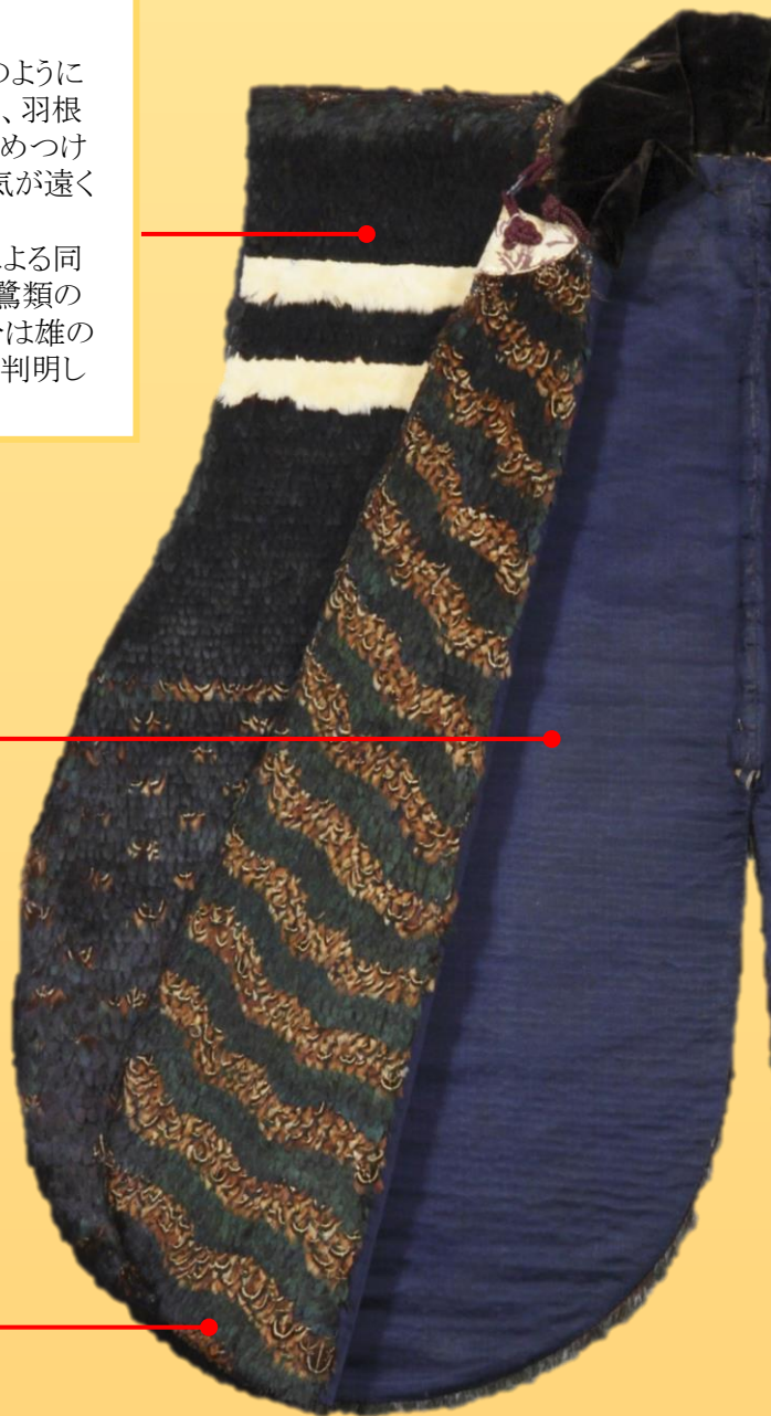
「鳥毛九曜紋付陣羽織」 前面(部分)

裾は逆ハート型の変った形をしています。騎乗の際に裾を捌きやすくするため、背中にはスリットが入っています。また、体を十分に動かせるよう、脇にもスリットが設けられています。さらに、襟は前を開いて固定できるつくりになっており、寒いときは襟を閉じ、ここぞという時は襟を開いて華やかな模様を見せつけます。