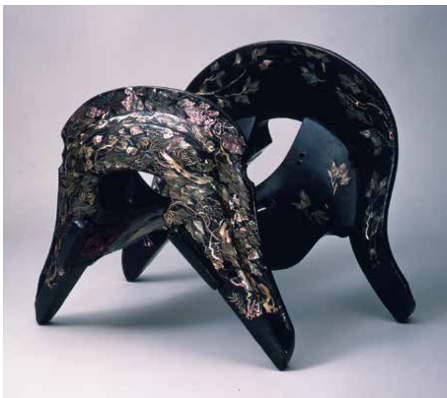
国宝「時雨螺鈿鞍」 鎌倉～南北朝時代（14世紀）永青文庫蔵